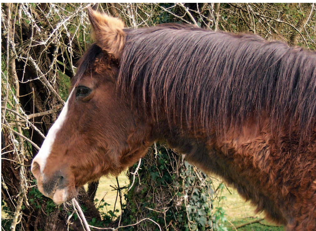
L'hirsutisme se manifeste par un poil permanent long et bouclé.